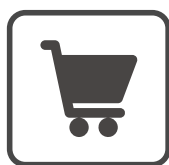
Tienda al por menor